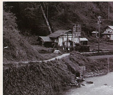
上水電気日影発電所全景(鬼無里村大字日影字長崎東沖)