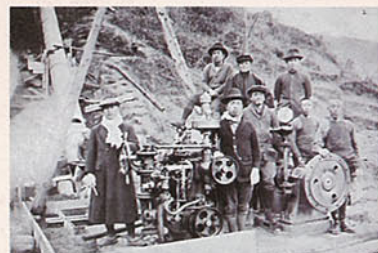
発電所敷地内に調速機などが運び込まれた(大正12年)

配電盤は水車、発電機の制御や監視をするためのものです。配電盤の機能は人間にたとえると頭脳部に当たるものであり、発生電力(電圧、電流、電力量)の監視と水車、発電機の運転・停止などの制御をするところです。当配電盤を自立垂直型で盤には大理石を使用しています。